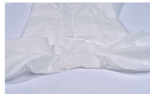
しゃがんだ時に突っ張りにくい股マチ