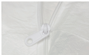
持ち手の大きいファスナー