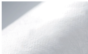
汗のべたつきが少ないSMS素材