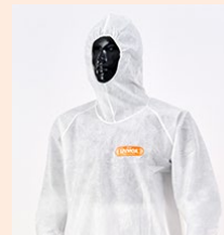
セパレート服 上衣 ヤッケ