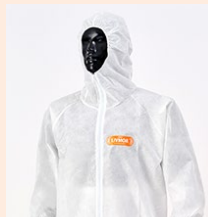
セパレート服 上衣ファスナー付き