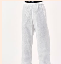
セパレート服 下衣