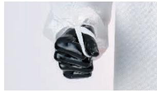
袖のずり上がりを防ぐ指ゴム