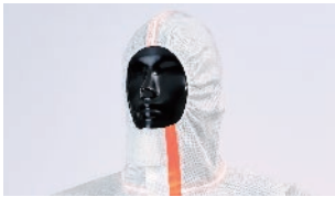
密閉性を向上させたフード

お客さまの声を反映させ、動きやすさをサポートする「Active仕様」を取り入れました。